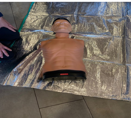
Unsere Reanimationspuppe. Die Gruppe hat die Reanimation vorbildlich ausgeführt.