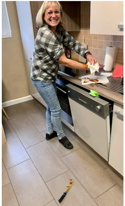
Übung mit realistischer Vorbereitung von tiefen Schnittwunden mit Schock