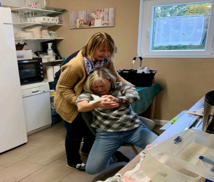
Auffindung der verletzten Person mit tiefer Schnittwunde und Schockzustand.