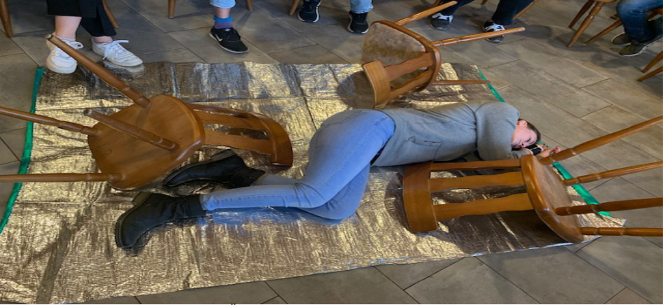
Krampfanfall/Epileptischer Anfall-Übung und deren Maßnahmen.